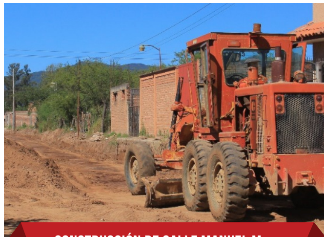
•CONSTRUCCIÓN DE CALLE MANUEL M. DIEGUEZ $2,000,000.00