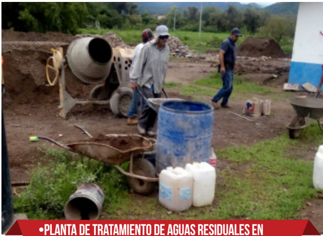
•PLANTA DE TRATAMIENTO DE AGUAS RESIDUALES EN EL MUNICIPIO DE MASCOTA, JALISCO. (ADECUACIÓN DEL ENTORNO DE LA PLANTA DE TRATAMIENTO DE AGUAS RESIDUALES Y RIBERA DEL RÍO MASCOTA). $7,331,284.99