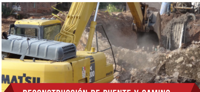
RECONSTRUCCIÓN DE PUENTE Y CAMINO EN SANTA ROSA $7,100,000.00