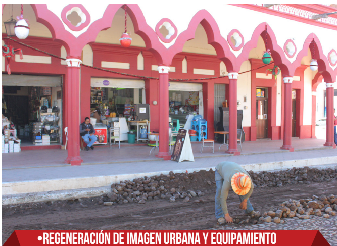
•REGENERACIÓN DE IMAGEN URBANA Y EQUIPAMIENTO TURÍSTICO DEL CENTRO HISTORICO (REMODELACIÓN DE PLAZA PRINCIPAL, FACHADAS, BANQUETAS PERIMETRALES E ILUMINACIÓN ARTÍSTICA). $10,000,000.00