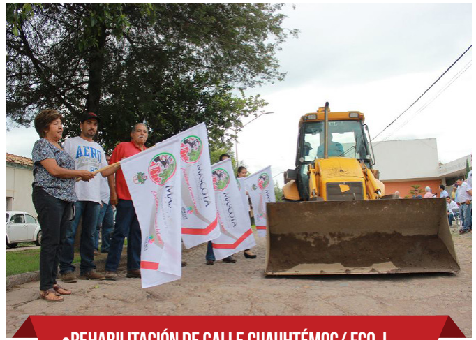
•REHABILITACIÓN DE CALLE CUAUHTÉMOC/ FCO. I MADERO, ENTRE ALTAMIRANO Y SALIDA A CARRETERA A GUADALAJARA; PRIMERA ETAPA. $4,166,666.67