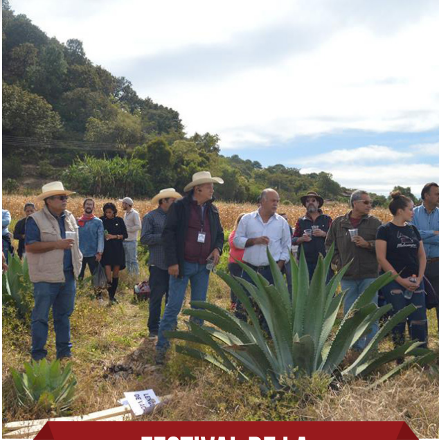
FESTIVAL DE LA RAICILLA