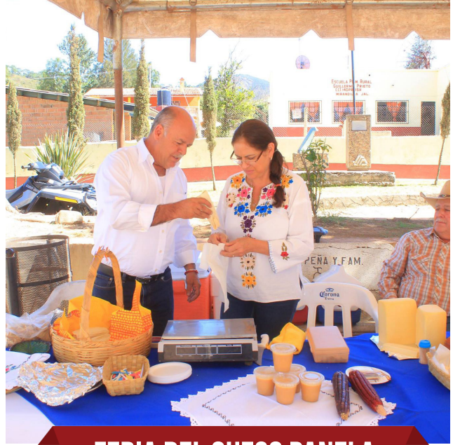
FERIA DEL QUESO PANELA Y ADOBERA