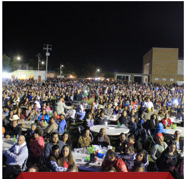
FERIA DEL PUEBLO