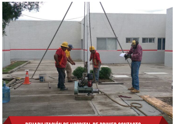
•REHABILITACIÓN DE HOSPITAL DE PRIMER CONTACTO EN LA CABECERA MUNICIPAL DE MASCOTA, JALISCO. $3,448,275.87